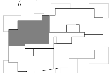
ÉTAGE 14 (Penthouse)

Note 1: Pour la cuisine (comptoirs et armoires) et la/les salle(s) de bain, ou salle d'eau, se référer aux dessins du fabricant pour les dimensions et le positionnement du mobilier et des appareils.